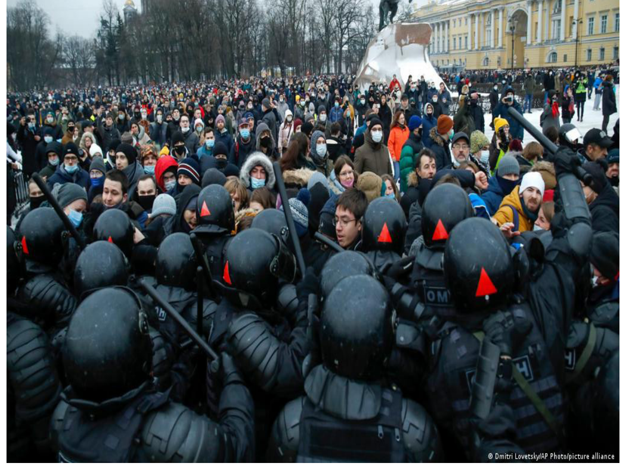
«لحظة أحادية القطب»

بيد أن المشاركة في اجتماعات الحلف ظلت حصرا على أوروبا وأمريكا الشمالية، الأمر الذي تغير الآن. فقد تمت دعوة اليابان، وأستراليا، وزيلندا الجديدة، وكوريا الجنوبية، للمشاركة في قمة مدريد بصفتها «شريكات» الناتو في منطقة آسيا والمحيط الهادئ - ما يمثل استفزازا خطيرا جدا لبكين التي لن يسعها سوى أن ترى في تلك الدعوة خطوة نحو توطيد التحالفات التي تقودها الولايات المتحدة الأمريكية في شبكة عالمية موحدة ضد روسيا والصين. وقد صرح الأمين العام للحلف، ينس ستولتنبرغ، إثر اجتماع تمهيدي لوزراء دفاع دول الناتو انعقد يوم 16 يونيو/حزيران، أن «المفهوم الاستراتيجي الجديد» للناتو المرتقب تبنيه في قمة مدريد سيعرض موقف الحلف «من روسيا، ومن